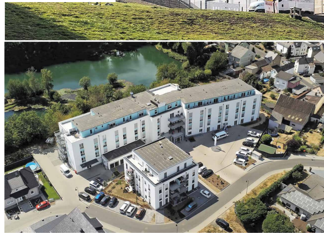
Seniorenresidenz Pellenz in Krufft im Kreis Mayen-Koblenz: Seniorenresidenz mit 83 Pflegezimmern & Wohnhaus mit 12 Wohneinheiten.

Jedes ZENZ-Massivhaus wird von einem hauseigenen Architekten nach Ihren individuellen Wünschen und Vorstellungen geplant und auf Ihr persönliches Grundstück angepasst.