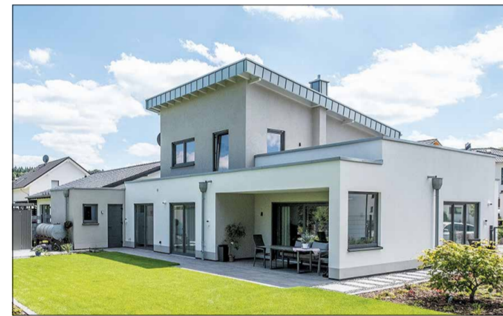
Individuell geplante Einfamilienhäuser

Als mittelständiges Familienunternehmen mit Zentrale in Cochem-Braunfels und Niederlassungen in Bonn und Trier vereinen wir seit 1948 traditionelle Werte wie Qualität, Kompetenz und Verlässlichkeit in solider Bauweise und zum Festpreis. Jedes ZENZ-Haus verbindet dabei innovative Techniken und