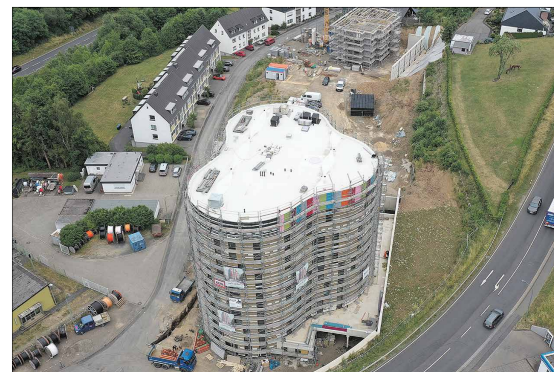
Als Generalunternehmer realisiert ZENZ-Massivhaus für die LEPPER-Stiftung e.S. derzeit die Junior Uni Daun.