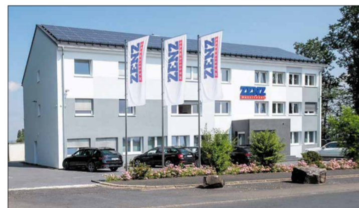
ZENZ-Massivhaus Firmenzentrale in Cochem

Mit über 3.000 realisierten Bauprojekten ist ZENZ-Massivhaus eines der erfahrensten Bauunternehmen in Rheinland-Pfalz.